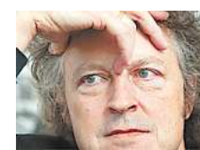
„Tolle Marktlücke? Das haben wir uns nie überlegt.“ Wolfgang Niedecken

Die Fahrgäste lachen und ein Mann sagt: „Das ist lange vorbei, dass der hier unerkannt durch die Stadt gehen kann.“ Und Niedecken redet mit dem Mann ein bisschen über die Zeit, in der die Kölner Südstadt am Wochenende von Fans belagert war, in den achtziger Jahren, als BAP auf allen Radiosendern lief. Damals habe er sich bewusst gegen ein abgeschottetes Promi-Leben entschieden, sagt Niedecken: „Das fände ich viel zu langweilig. Und außerdem: Würüber sollte ich dann schreiben?“ Und um die beiden herum fangen die Leute an zu reden. Und jeder kann eine Geschichte erzählen, die er mit BAP oder mit Niedecken erlebt hat. Oder während eines der BAP-Lieder lief.